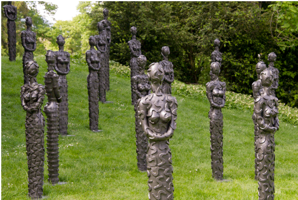
Die unifomre Frau passt in jedes Modelabel .... von Shimmi Schadegg

Beeindruckende Werke auf unserem Rundgang von Schweizer Künstlern: