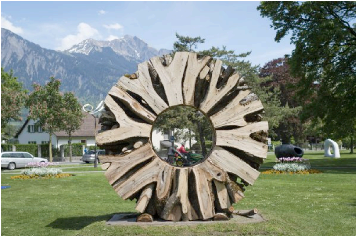
Ein beeindruckendes Werk aus Astgabeln des Schweizer Künstlers Urs P. Twellmann

Ab dem 9. Mai 2015 heisst Bad Ragaz wieder Bad RagARTz. Art in Blau wird uns als Bad RagazARTz 2015 durch den Alltag begleiten. Bad RagazARTz ist sechs Monate lang der grösste Skulpturenpark Europas – ein grosses Gesamtkunstwerk unter freiem Himmel. Kunst geht hinaus, aus Museen und Konzertsälen, ins Freie, unter Menschen. Unter dem Leitgedanken «sehen, verstehen, lieben» ist der ganze Lebensraum der Triennale Bad RagARTz gefüllt mit Skulpturen und Musik. Orte der Begegnung, der Muse, des entspannten Gehens, der Ruhe im Schatten der Bäume, des Nachdenkens und Nachsinnens.