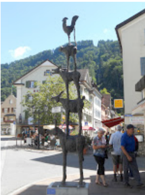
Beim „Blinden Passgier“ in der Dorfmitte und seinem Bezug zur hochaktuellen Thematik der Integration von Fremden nahm unser Rundgang sein Ende.